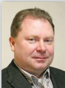
ZENON MAJKUT WIMAD SPÓŁKA JAWNA

TAKIE MAMY TERAZ CZASY, ŻE POTENCJALNI NABYWCY URZĄDZEŃ WARSZTATOWYCH NIECHĘTNIE TRAKTUJĄ PROPOZYCJE NOWYCH ZAKUPÓW. WOLĄ RACZEJ ZACHOWAĆ BEZ STRATY ZGROMADZONE JUŻ ŚRODKI FINANSOWE