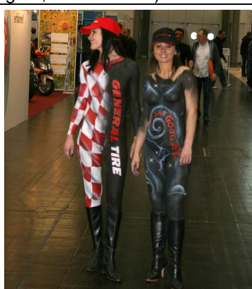
Wytyż wzrok i znajdź brakujące ubranie.