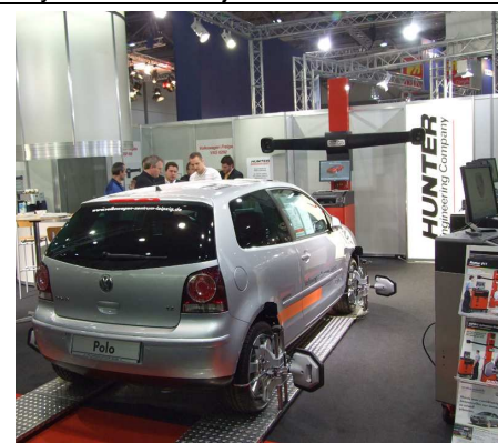
Stoisko HUNTER. Nowy system WA z kamerami HawkEye