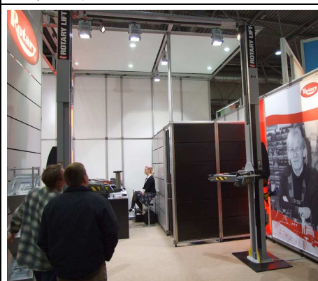
Stoisko ROTARY. Patrz pan jaki duży.