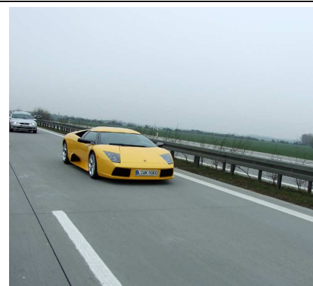
Chyba nas nie dojdzie...