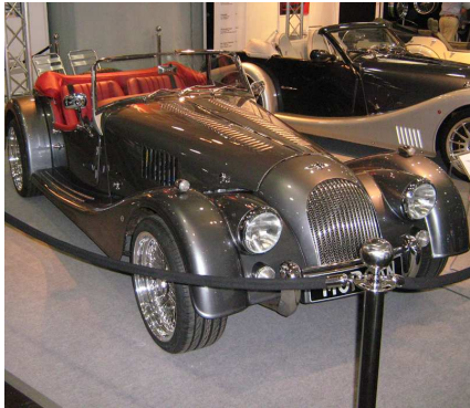
Byłby świetny do dostarczania urzędzeń.