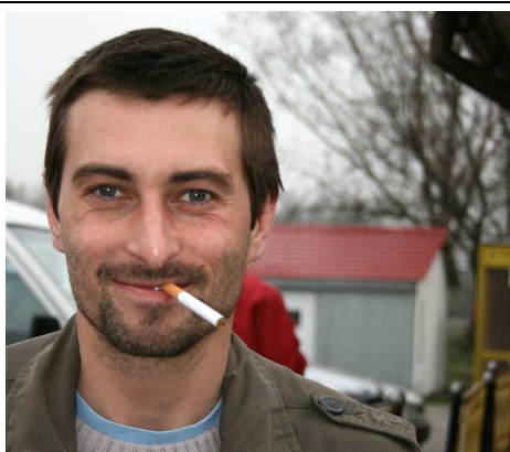
My name is Bond, Siergiej Bond.