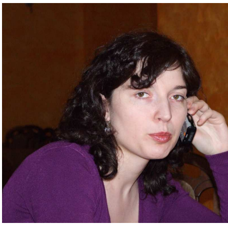
Oka, Oka - słyszysz mnie (Ania)?