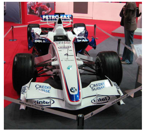
A Robert gdzie?