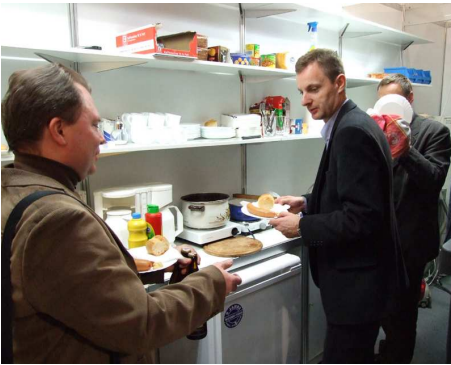
Gdzie kucharki trzy tam... (poczęstunek na stoisku SAXON).